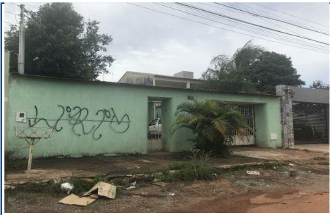
Vista da Fachada