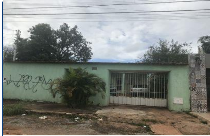
Vista da Fachada