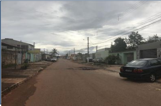
Vista do Logradouro com o imóvel à direita